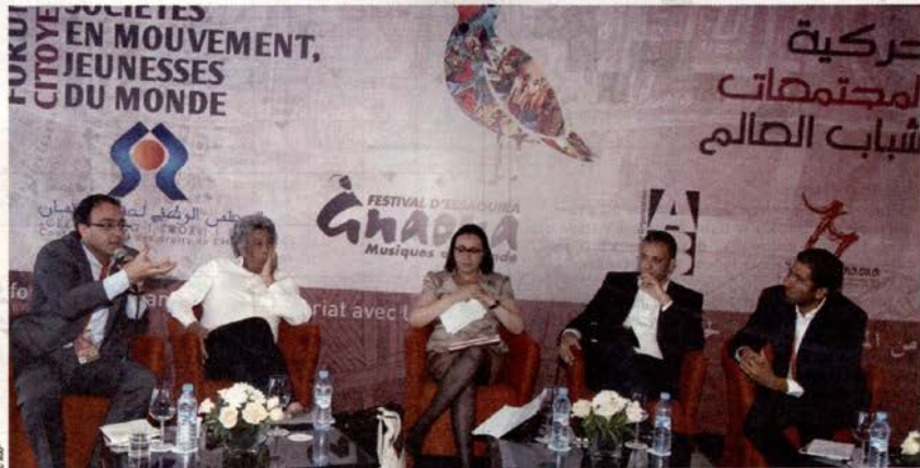
Le président de la Chambre des représentants, Karim Ghellab, a pris part samedi au Forum « Société en mouvement, Jeunes du monde », organisé dans le cadre du Festival Gnaoua et musiques du monde.

Cette édition du Festival Gnaoua et musiques du monde a tenu ses promesses. Une programmation musicale de qualité, des scènes qui ont suscité une effervescence de vibrations positives, des expositions, des concerts intimistes, des rencontres humaines avec des artistes de renommée internationale en toute spontanéité et simplicité... tout ceci dans le cadre magique de la ville aux quatre vents.