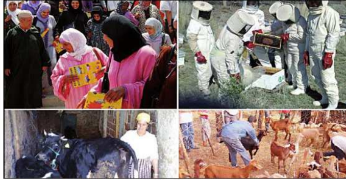
من أنشطة جمعية أمزازن

ومن رصيد «جمعية أمزازن للتنمية المحلية»، حسب ملف حصلت «الاتحاد الاشتراكي» على نسخة منه، توزيعها لـ 8000 شجرة زيتون على فلاحي المنطقة في إطار مشروع «ميدا»، ولأجل الإنخراط في الاستفادة من مشروع لتربية الماعز، بادرت الجمعية إلى توزيع 63 رأس ماعز لفائدة 9 مستفيدات من نساء المنطقة، في إطار مشاريع المبادرة الوطنية للتنمية البشرية، وقد سبق للجمعية أن استقبلت وفداً من مدينة العيون على خلفية تبادل الخبرات والتجارب في مجال تربية الماعز، بالتنسيق مع اللجنة الإقليمية للمبادرة الوطنية للتنمية البشرية، نظراً لما لهذا المجال من دور ملموس في تحسين ظروف العيش للمرأة والفتاة القروية.