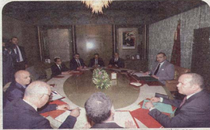
جلالة الملك أثناء ترؤسه جلسة عمل حول موضوع الهجرة

خلال نفس الاجتماع، أصدر جلالته الملك، توجيهاته للحكومة للإسراع بوضع وتفعيل استراتيجية ومخطط عمل ملائمين، والتنسيق في هذا الشأن مع المجلس الوطني لحقوق الإنسان ومختلف الفاعلين المعنيين، بهدف بلورة سياسة شاملة ومتعددة الأبعاد لقضايا الهجرة ببلادنا، بما من شأنه أن يوفر للمغرب قوة اقتراحية حقيقية في هذا المجال ويمكنه من القيام بدور ريادي وفعال على الصعيدين الجهوي والدولي. وخلص البلاغ إلى أن هذه المبادرة الملكية، التي تندرج في إطار الرصيد العريق للمغرب كبلد لحسن الضيافة والاستقبال، تجسد الانخراط القوي والموصول لجلالة الملك في حماية حقوق الإنسان، طبقا لمقتضيات الدستور، وفي احترام لدولة القانون، وبما ينسجم مع الالتزامات الدولية للمغرب.