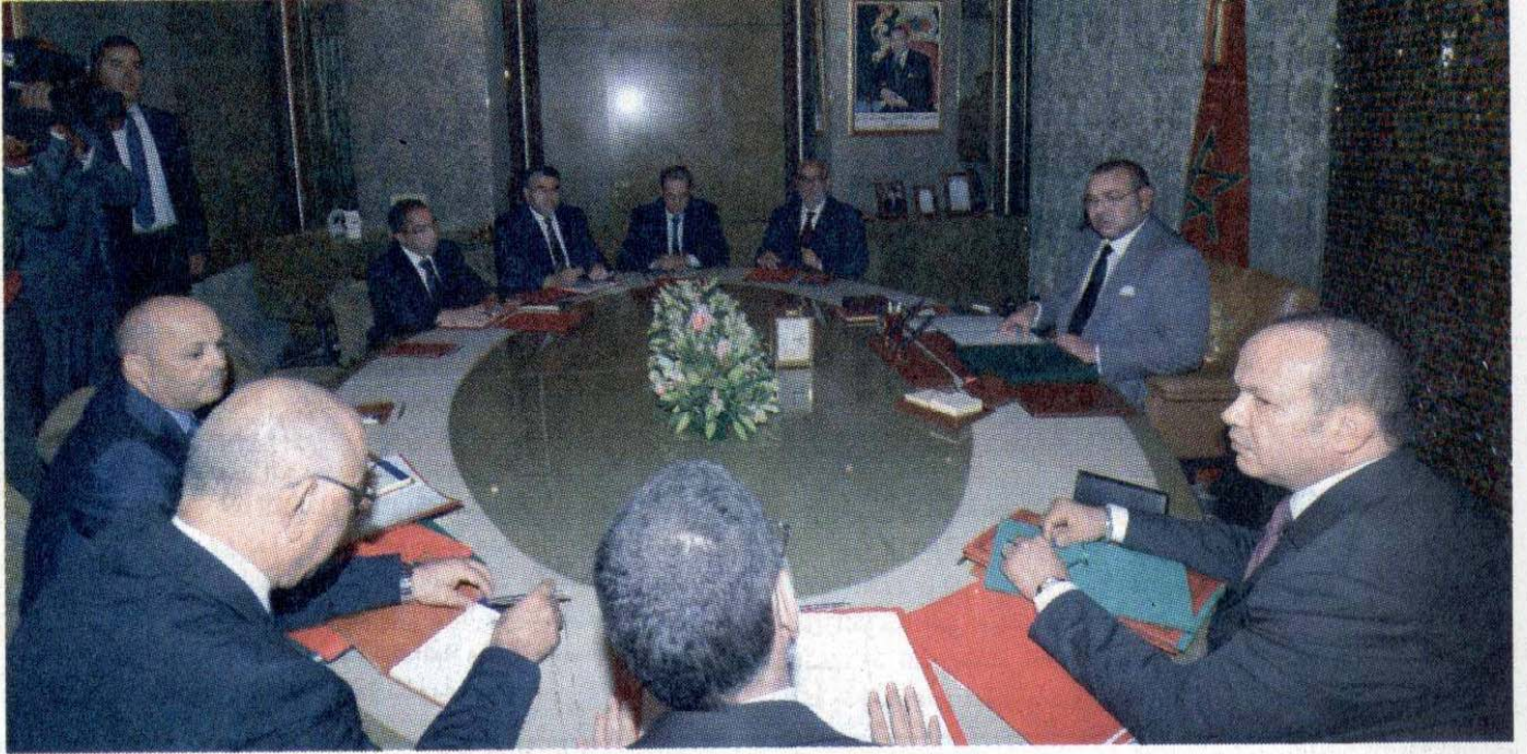
جلالة الملك يترأس جلسة عمل مع مسؤولين في الدولة

العمومية والمهاجرين. وأشار البلاغ إلى أنه إذا كان تدبير قضايا المهاجرين غير الشرعيين، يعرف أحيانا بعض التجاوزات التي تبقى معزولة، فإنه ليس هناك أي استعمال ممنهج للعنف من قبل القوات العمومية. لذا، فإن المغرب يرفض رفضا قاطعا الادعاءات التي تحاول ربط تدبير مشاكل المهاجرين غير الشرعيين بالعنف وخرق حقوق الإنسان المهاجر، في محاولة يائسة للمس بسمعة المغرب.