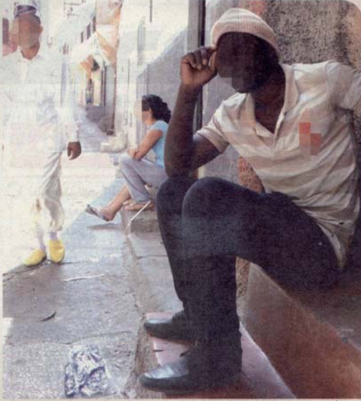
أحد المهاجرين المنحدرين من جنوب الصحراء (أرشيف)

والمهاجرين في البشر فضلا عن أشكال العنف التي يعاني منها المهاجرون طوال رحلة الهجرة والتي تظلم أحيانا حتى قبل دخولهم التراب الوطني، يقول التقرير، مضيفا أن حق السلطات المغربية في مراقبة دخول الأجانب للحد والإقامة به وواجبها المتعلق بمكافحة الاتجار في الأشخاص، يجب أن يتم في إطار مراعاة المتطلبات الدستورية في مجال حقوق الإنسان وحقوق الأجانب وكذا الالتزامات الدولية للمغرب التي تتركسها مصادقة على مجموع الصكوك الدولية الخاصة بحماية حقوق الإنسان. انطلاقا من هذه العناصر، يدعو المجلس الوطني لحقوق الإنسان السلطات العمومية ومجموع الفاعلين الاجتماعيين والبلدان الشريكة للمغرب إلى أخذ الواقع والمستجدات التي يشهدها العالم بعين الاعتبار والعمل بشكل مشترك من أجل بلورة وتنفيذ سياسة عمومية فعّالة في مجال الهجرة، وضامنة لحماية الحقوق ومرتكزة على التعاون الدولي وقائمة على إدماج المجتمع المدني. أختار المغرب المقاربة الشاملة، ذات الطابع الإنساني المستندة إلى القانون الدولي بمبادئه الأساسية، من أجل التعاطي مع إشكالية الهجرة، ولا يختلف اثنان على أهمية الموضوع الذي يعني المغرب باعتباره جسرا بين أوروبا وإفريقيا، وبندا يصنف ضمن خانة الدول المعنية بعملية التنقلات البشرية، لكن قبل ذلك، يتعين توعية الفاعلين المجتمعيين، بأهمية نبد خطاب العنف والتمييز وكراهية الأجانب والعنصرية، حتى نجد توصيات المجلس الوطني لحقوق الإنسان، طريقها السلس إلى التنزيل والتنفيذ.