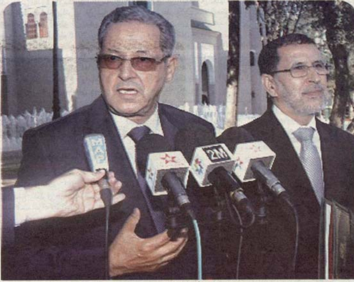
العنصر والعنصر بعد ثمانية جلسة العمل التي ترأسها جلالة الملك