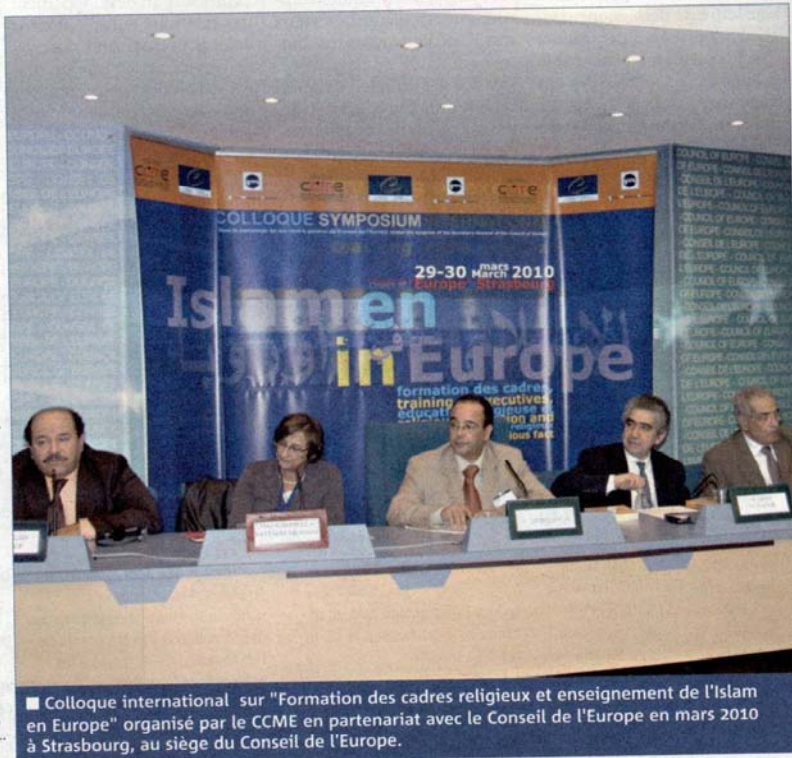
■ Colloque international sur "Formation des cadres religieux et enseignement de l'Islam en Europe" organisé par le CCME en partenariat avec le Conseil de l'Europe en mars 2010 à Strasbourg, au siège du Conseil de l'Europe.

Après plus de cinq ans d'existence (il a été créé le 21 décembre 2007), quel bilan peut-on faire du travail du Conseil de la communauté marocaine de l'étranger (CCME) ? De cette instance voulue par le Roi Mohammed VI, recommandée par l'Instance équité et réconciliation (IER), sur laquelle comptaient des millions de Marocains résidant à l'étranger pour améliorer leur image, être associés aux politiques publiques de leur pays et à son devenir par leurs compétences ? Deux autres instances dédiées à la même cause, un ministère et la Fon-