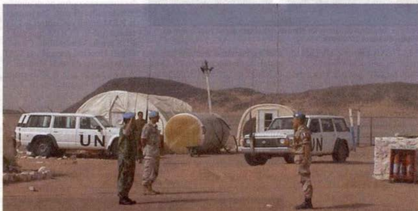
La MINURSO a été créée le 29 avril 1991 par la résolution 690 du Conseil de sécurité de l'ONU.

Président de l'IMRI (Institut Marocain des Relations Internationales)