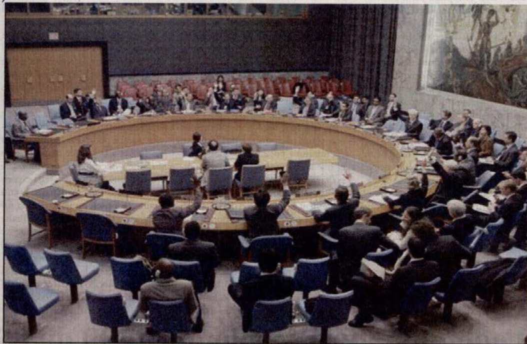
Cette nouvelle résolution ne contient aucune mention dotant la Minurso d'un mandat d'observation des droits de l'Homme.

À juste titre, cette nouvelle résolution ne contient aucune mention dotant la Minurso d'un mandat d'observation des droits de l'Homme. A contrario, elle reconnaît de manière explicite les avancées du Royaume en matière des droits de l'Homme, reconnues au demeurant par la communauté internationale, à travers notamment le Conseil national des droits de l'Homme, qui porte la marque