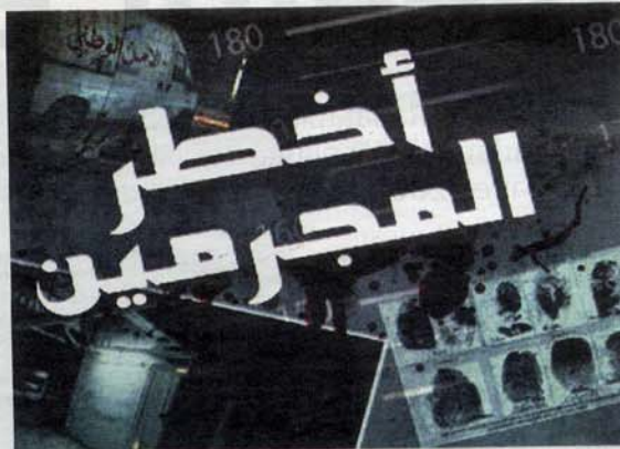
Sur décision de la Haca, l'émission à grand audimat pourrait être suspendue.