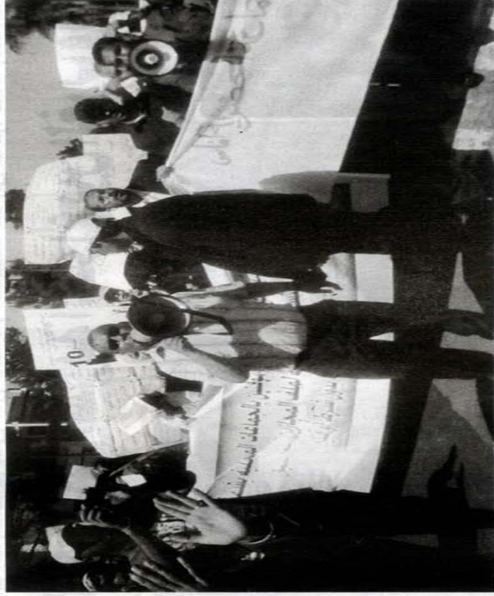
موظفو الجماعات المحلية الجازيرين في وقفة احتجاجية سابقة

المجازيرين المؤقتين بالجماعات المحلية، في اتصال هاتفي اجزته معه «أخبار اليوم»، إن لجزونا إلى المجلس الوطني اعتبار أن هذه المؤسسة تعنى بحقوق الإنسان على مستوياتها الثلاثة، الاقتصادية والاجتماعية والسياسية، ونحن نعتبر انفسنا فئة تعاني من الإقصاء المزوج، بعد أن اشتقتنا لسنوات عديدة في الجماعات المحلية وفي ظروف طغت عليها مظاهر الحسوبة والزيونية المخروصة على الموظفين تجاه من يدبر شؤون الجماعة، الشيء الذي حال دون إدماجنا في السلم العاشر الذي يمنح إيانا القانون».