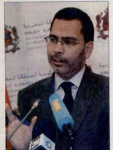
Mustapha El Khalfi.

En tout premier lieu, et c'est ce qui témoigne d'une véritable évolution de l'État de droit et de liberté, on a abouti à l'élimination de la peine privative de liberté dans le Code de la presse. Dans ce sens, et en respect des articles 19 et 20 de la Convention internationale des droits civils et politiques, on a aussi abouti à l'élargissement de l'intervention de la justice aux dépens du gouvernement, à la mise en place d'une instance indépendante d'autorégulation, le Conseil national de la presse. L'article 28 de la Constitution souligne en effet que «les pouvoirs publics doivent favoriser l'organisation du secteur de la presse de manière indépendante et sur des bases démocratique ainsi que la détermination des règles juridiques et déontologiques le concernant». Les représentants de cette instance le seront par des élections. En toute