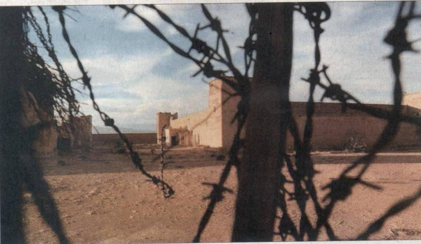
الفناء الخارجي لمعتقل قلعة مكونة

تكنة فرنسية تحولت إلى معتقل سري ضم 400 محتجز أغلبهم يتبنون الأطروحة الانفصالية