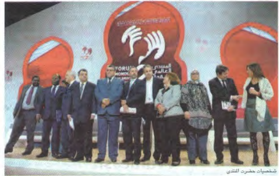
شخصيات حضرته المنتدى