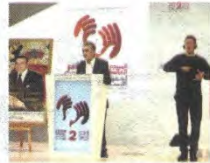
البريزي في كلمة له بمناسبة

المغربية للنساء، القاضيات، إلى تمثيلية المرأة في سلك القضاء، منبهة الكسب التي تقفها المرأة الغربية في ظل القيادة الماكية في هذا المجال، وقالت الناصري من خلال مداخلتها أنه لا يوجد