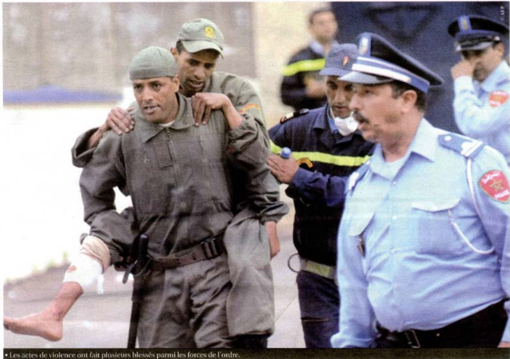
• Les actes de violence ont fait plusieurs blessés parmi les forces de l'ordre.