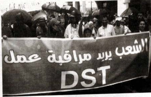
من شعارات حركة 20 فبراير