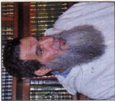
يوزن بموازين غير المسلمين... ثم تلجأ امرأة تافهة للاعتار عن عقيدة المغاربة المسلمين وتعلن على رؤوس الأشهاد أنك مع المساواة في تقسيم التركة من غير ابرك منظومة الشريعة الإسلامية ولفسفتها الاجتماعية التي تملأها الرحمة والعمل في أعلى صورها... لكن ماذا أقول في من لا يرى ضياء الشمس إذا كان يشكو من العمى؟

في ما يخص الأول فقط وليس في عموم تقسيم التركة. وعليك أن تعلم أن الشريعة الإسلامية تنص على أن الرجل والمرأة في حالات أخرى كقوله تعالى [والأزواج منكم بما آتاهن منكم ما يحبون] فالأزواج منكم بما آتاهن منكم ما يحبون. وفي حالة معينة كما أن الأنتي لها حصة في التركة أكبر من الذكر في حالات أخرى... ويكفي أن تراجع قوله تعالى: يُوصِيهِ اللَّهُ فِي الْوَارِثَةِ لِلذَّكَرِ مِثْلَ الْأُنثَىٰ فإن من نساء فريق الأنتين فلهن مثلنا ما ترك وإن كانت واحدة فلها النصف ولأخوته كل واحد منهما السدس مما ترك إن كان له ولد فإن لم يكن له ولد وورثته أبواه فلأمه الثلث فإن كان له إخوة فلأمه السدس من بعد أبويه. يُوصِيهِ اللَّهُ فِي الْوَارِثَةِ لِلذَّكَرِ مِثْلَ الْأُنثَىٰ أي إن كان له إخوة فلأمه الثلث فإن كان له إخوة فلأمه السدس من بعد أبويه. يُوصِيهِ اللَّهُ فِي الْوَارِثَةِ لِلذَّكَرِ مِثْلَ الْأُنثَىٰ أي إن كان له إخوة فلأمه الثلث فإن كان له إخوة فلأمه السدس من بعد أبويه. يُوصِيهِ اللَّهُ فِي الْوَارِثَةِ لِلذَّكَرِ مِثْلَ الْأُنثَىٰ أي إن كان له إخوة فلأمه الثلث فإن كان له إخوة فلأمه السدس من بعد أبويه.