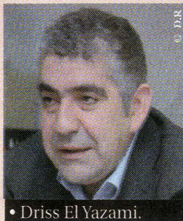
• Driss El Yazami.

Le président du Conseil national des droits de l'Homme (CNDH), Driss El Yazami, a entamé lundi une visite de trois jours à Washington visant à présenter le contenu des réformes contenues dans la nouvelle Constitution marocaine, y compris pour ce qui est du volet relatif aux droits de l'Homme, indique un communiqué du CNDH.