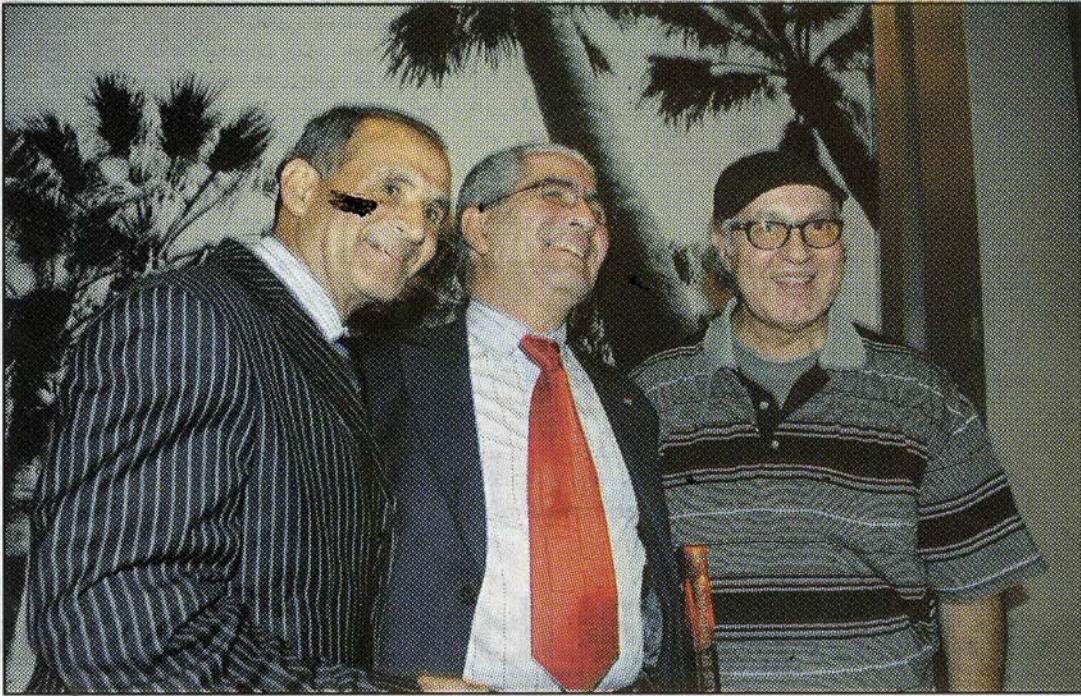
أحمد حرزني يتوسط عمر السيد وأحمد فرس

الكثير من الخطوات لا زالت تلوح في الأفق». يشار إلى أن أحمد حرزني، الذي ترأس المجلس الاستشاري لحقوق الإنسان خلال الفترة ما بين ماي 2007 ومارس 2011، خلفا للمرحل ادريس بنزكري، اشتغل على عدد من الملفات الحقوقية الكبرى، يبقى أهمها متابعة تنفيذ توصيات هيئة الإنصاف والمصالحة وإطلاق سياسة القرب في مجال حماية حقوق الإنسان، وإطلاق برامج النهوض بحقوق الإنسان، إلى جانب تعزيز انخراط المجلس في الدينامية الدولية لحقوق الإنسان.