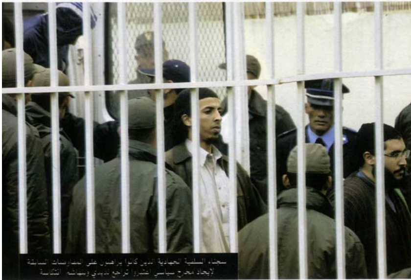
سجناء السلفية الجهادية الذين كانوا يترددون على المحاكمات السابقة لإيجاد مخرج سياسي لشؤونهم، في سجن سلا.