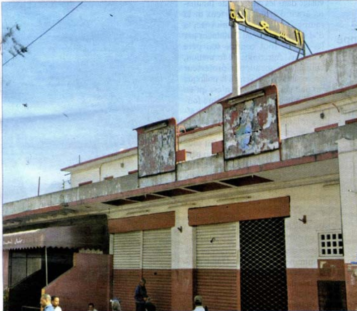
■ Cinéma Saada, aujourd'hui fermé, est l'un des principaux bâtiments historiques du Hay.

Jamais le quartier mythique Hay Mohammadi à Casablanca n'a connu une telle attention. La cité ouvrière, née à partir des années 20 du siècle dernier, a vécu un cauchemar par le fait d'héberger en son sein le commissariat de la honte, le centre de torture de Derb Moulay Chrif. La société civile, les pouvoirs publics et quelques vaillants militants des droits de l'homme ont juré de laver la souillure qui a éclaboussé «le Hay» et entreprennent depuis quelque temps un travail de réhabilitation communautaire du