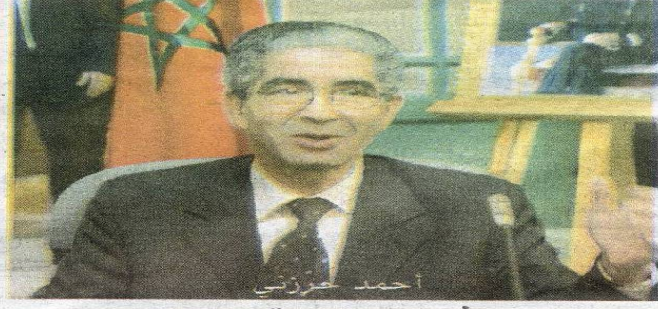
■ الرباط الأحداث المغربية

مقر المنظمة المغربية لحقوق الإنسان يجمع على طاولة واحدة عددا من الجمعيات الحقوقية (الجمعية المغربية لحقوق الإنسان، المنظمة المغربية لحقوق الإنسان، العصبة المغربية لحقوق الإنسان، المنتدى المغربي للحقيقة والانصاف، وجمعية عدالة) لتقديم الخطوط العريضة للمسيرة الوطنية التي سيشهدها شارع محمد الخامس بالرباط صبيحة يوم الأحد المقبل.