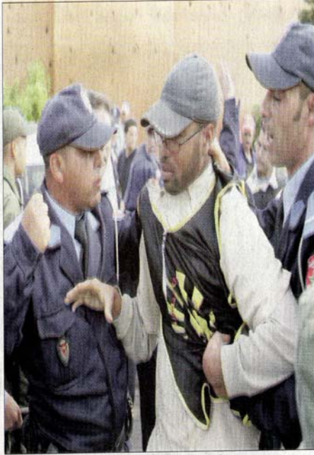
قوات الأمن تحاصر عابلا من حملة الشهادات العليا (أرشيف)

الرباط سجلت 1660 تجمعا سنة 2008 وتصدر قائمة المدن في حرية التظاهر